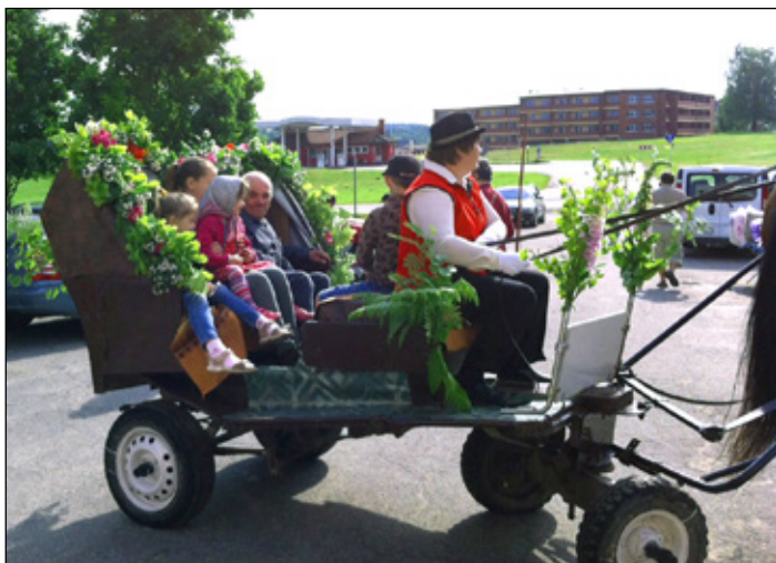
Līgo izbrauciens ar zirdziņu